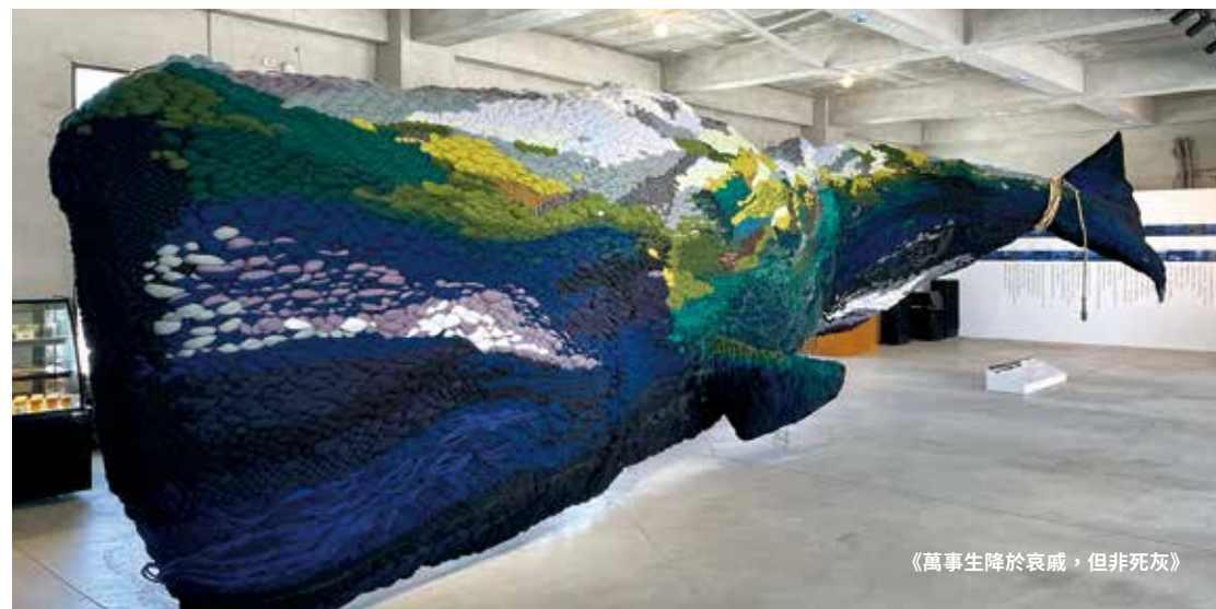
《萬事生降於哀戚，但非死灰》

1 「鯨落」隨鯨魚死亡，牠龐大的身軀會緩慢地沉入海底，而其遺骸將分階段的被不同的海洋生物分解。在食物貧瘠的深海，鯨魚的遺骸為海洋生物提供食物、生存和庇護場所。