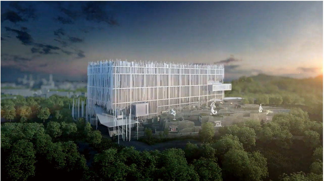
新北市美術館示意圖。

新北的美術館或博物館，既然是新北，我覺得要做出地方特色。像我們都是遊走兩岸，我說的兩岸是淡水河兩岸，這樣（遊走）的年輕人滿多的，這些年輕人不只兩岸，也有跨到國際上的東西，新北有很多很強的東西，就是剛剛講的中小企業的加工廠，你們可能忽略了，很多手機廠的下游在新北，例如蘋果的面板，以前手機技術後端的東西，新北市裡面有這樣的趨勢，另外是這幾年外籍移工的文化進來，第二代、第一代，文化交織出來時，是很珍貴的，我們不能去忽略它，主事者要有這樣的眼光。因為文化如果真的要立到標竿，就要像法國例如密特朗、龐畢度、季斯卡拉姆等（人物），眼光那麼大，它可以橫跨，去架構這東西。如果要做出真的不一樣，我覺得那不難，只是說你的眼光夠不夠遠。如果你五個十年、十個十年，或二十年之後，期待臺灣的藝術家，這一輩二三十歲藝術家去接受這樣的誘導，當他四十歲中壯年時，就是臺灣未來的寶。